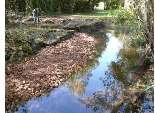
Photo de l'amont du seuil après travaux