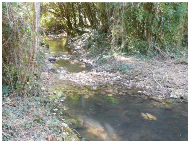
Photo de l'aval du seuil après travaux

Coût total du projet : 208€ HT (250€ TTC) (8 tonnes de silex à 26€/t) Sans compter le temps des agents