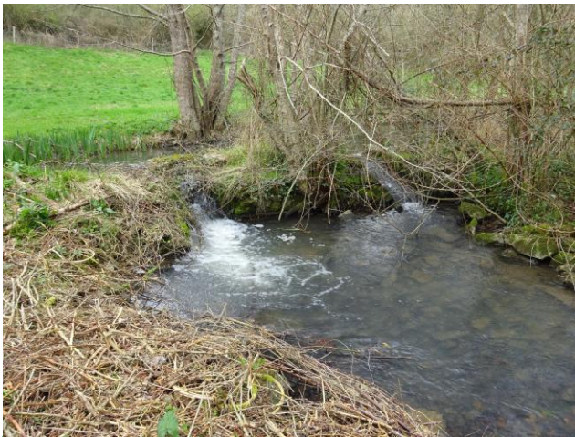
Photo du seuil avant travaux