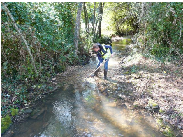
Photo de l'aval du seuil pendant les travaux