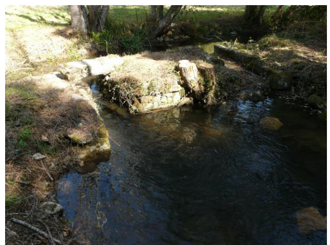
Photo du seuil après travaux