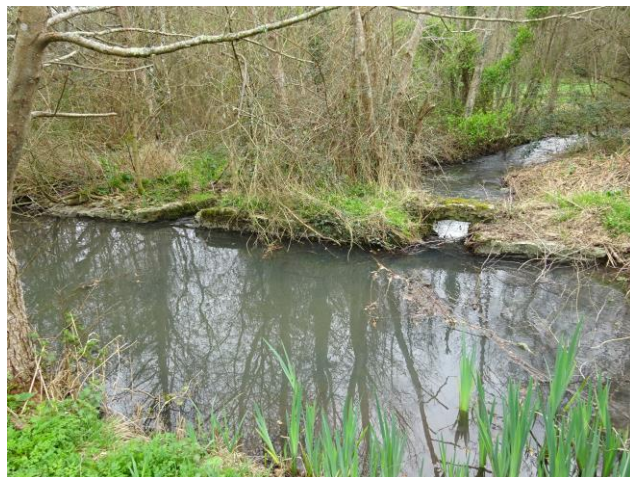
Photo de l'amont du seuil avant travaux