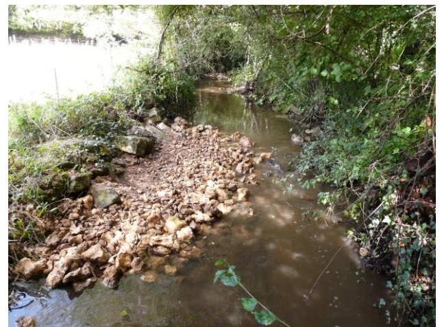
Photo de l'aval du seuil après travaux