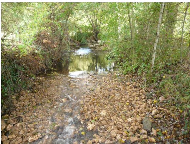
Photo de l'aval du seuil pendant les travaux