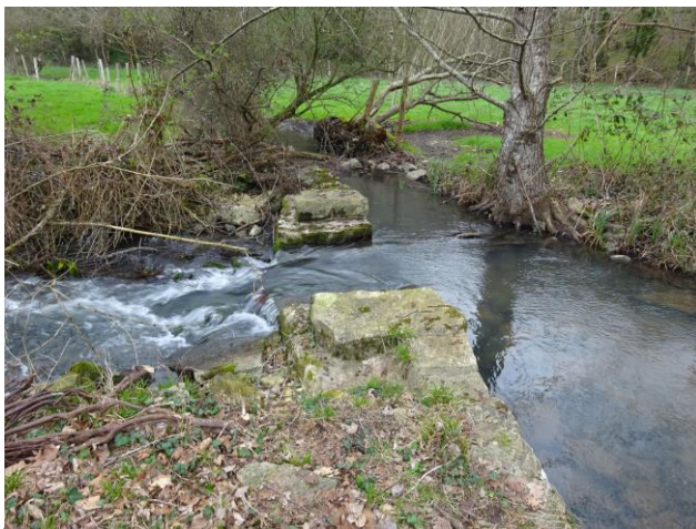
Photo du seuil avant travaux