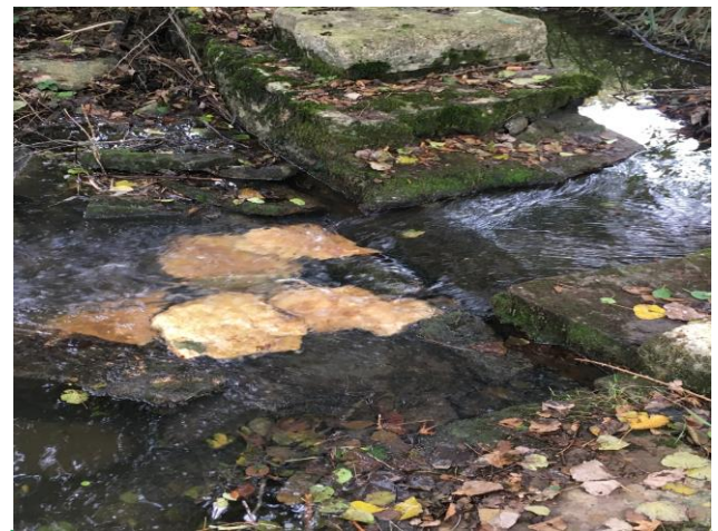
Photo du seuil après travaux