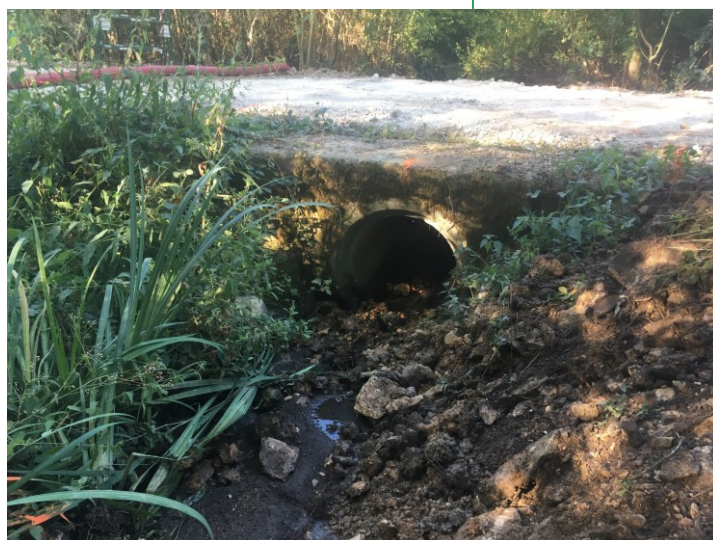
Ouvrage avant et après travaux (vue amont)