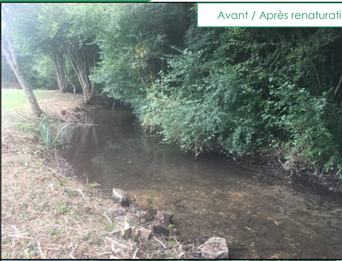
Avant / Après renaturation (bras de gauche)