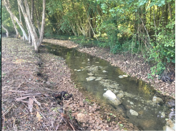
Avant / Après renaturation (bras de droite)