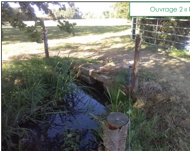
Ouvrage 2 « Passerelle » avant et après travaux