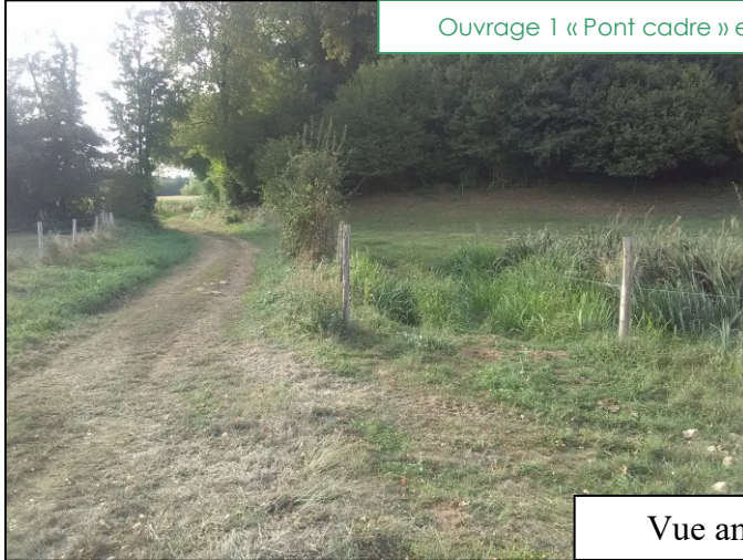
Ouvrage 1 « Pont cadre » et passage à gué avant et après travaux