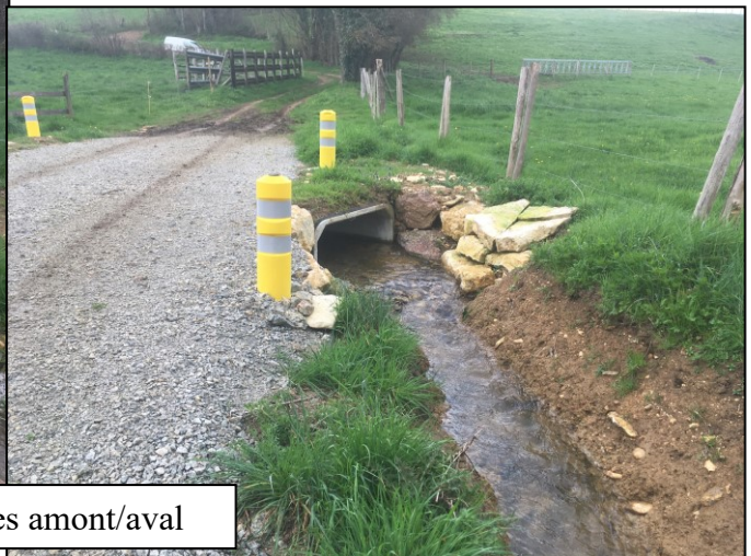
Pont cadre vues amont/aval