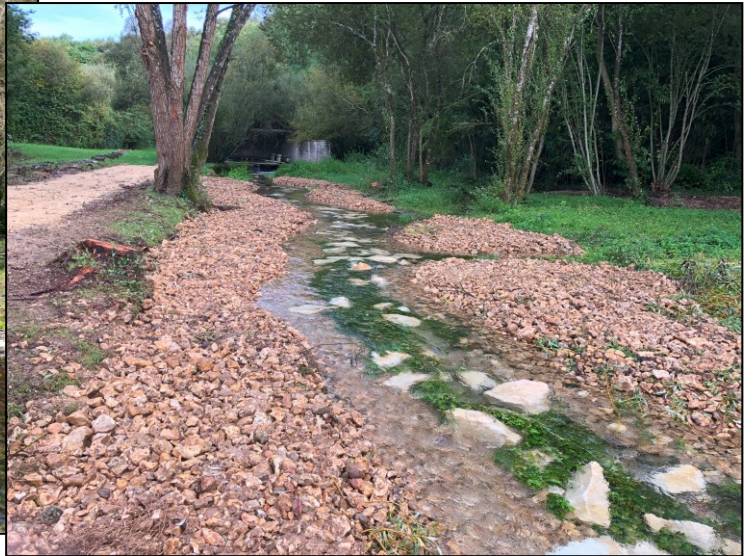
Avant / Après suppression du seuil